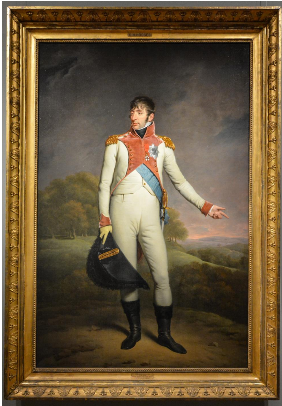
Afbeelding: Koning Lodewijk Napoleon op schilderij van Charles Howard Hodges uit de collectie van het rijksmuseum.

Dan is er nog een aantekening over deze persoon, tijdens het bezoek van Koning Lodewijk Napoleon.